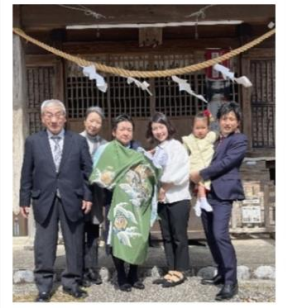
【初参り,もものすけちゃん】

3月下旬には河嶋家による初参りもしていただいております。津毛利神社が地域に密着していることが実感できた瞬間でした。