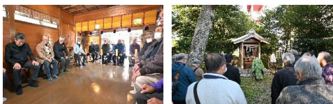
【新嘗(感謝)祭】 【御手洗(水)神社】例祭